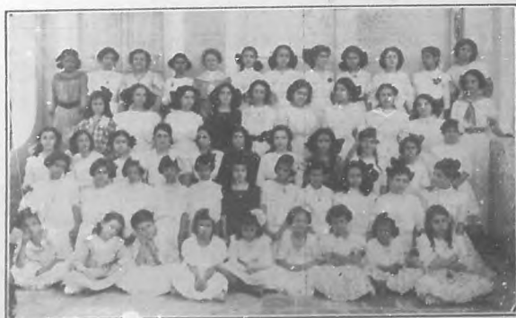
Grupo de alumnas del Colegio.