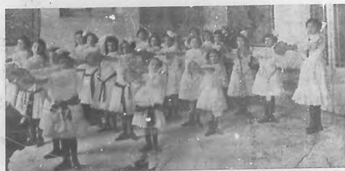
Grupo de alumnas ejecutando ejercicios de calistenia

Testigos en más de una ocasión de la prodigiosa laboriosidad de esta dama de mérito extraordinario, sentimos hoy satisfacción inmensa al ofrecerla con este homenaje de admiración hacia ella y sus colaboradoras, el modesto tributo de justicia de que nos consideráramos deudores en esta página dedicada al enaltecimiento de los buenos educadores, y por donde han de desfilár todos cuantos en el ejercicio del apostolado de la enseñanza se distinguan.—Juan S. Padilla.